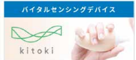
JT様とのオープンイノベーションにより生まれた製品