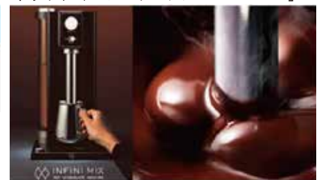
ホットチョコレートマシン「INFINI MIX」

*第1回日本オープンイノベーション大賞 科学技術政策担当大臣賞受賞(2019.3)